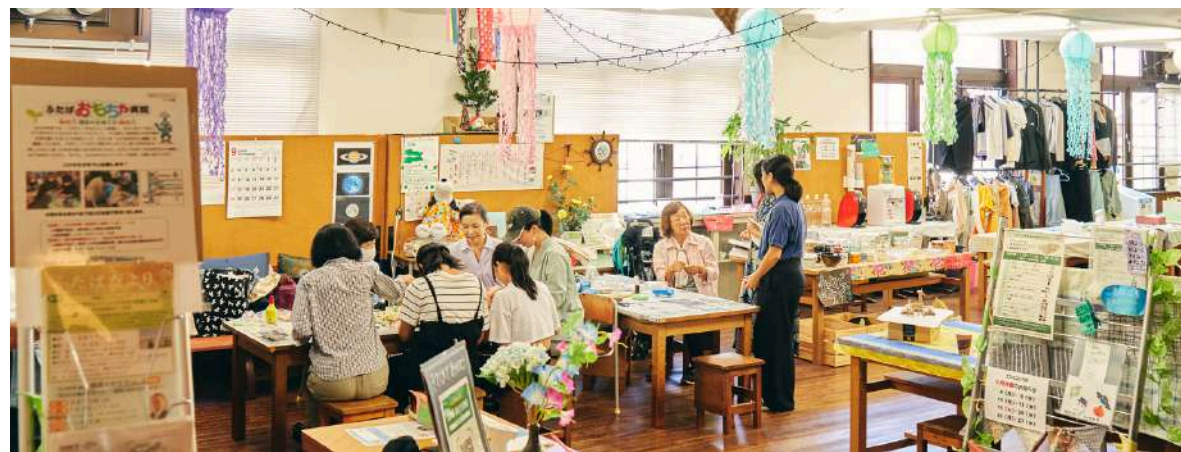
神戸市「ふたば資源回収ステーション」