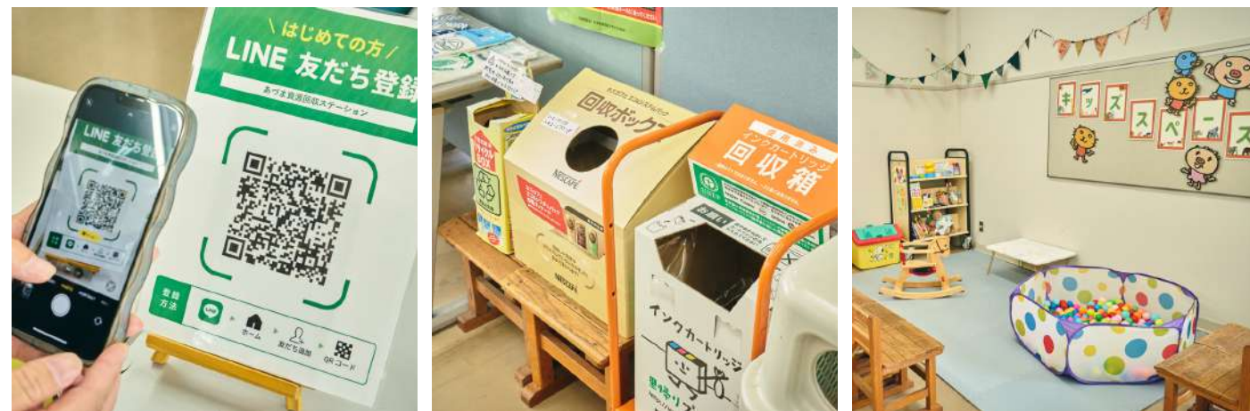
神戸市「あづま資源回収ステーション」