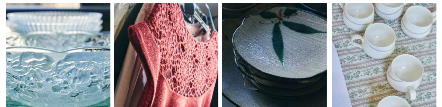
神戸市「ふたば資源回収ステーション」