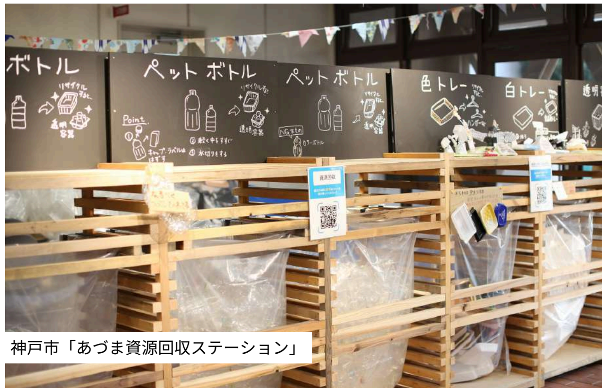
神戸市「あづま資源回収ステーション」