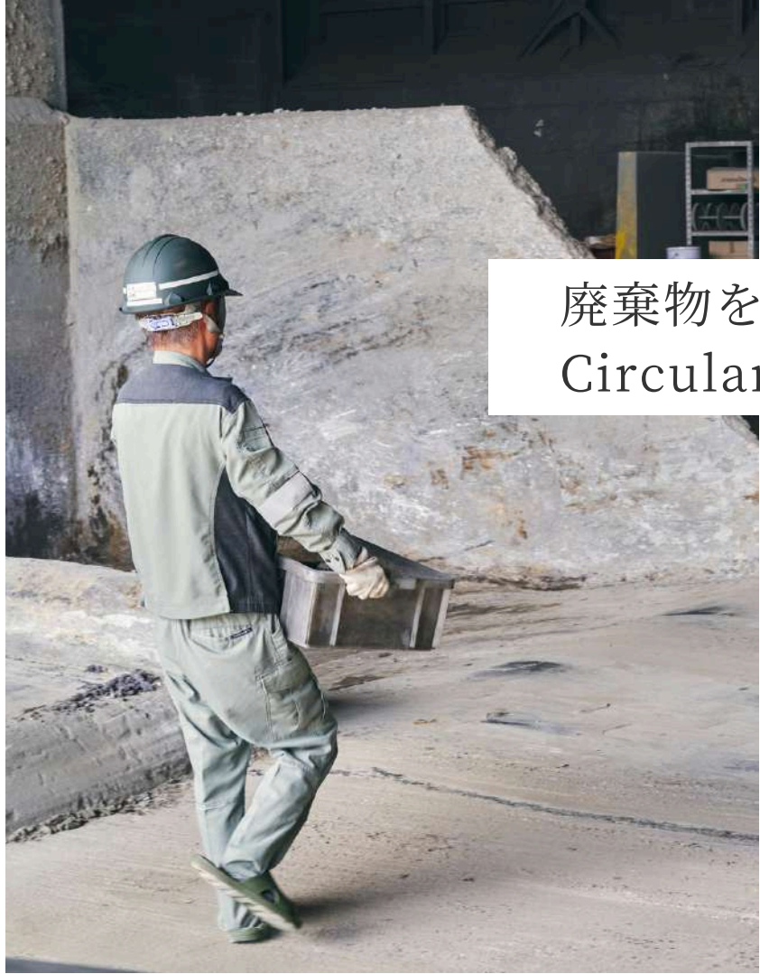
廃棄物を資源に変える Circular Economy Professional